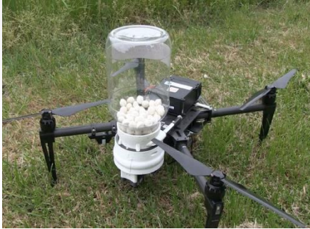
Distribuzione di Trichoderma Brassicae contro la piralide del mais